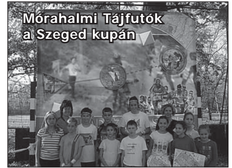
Mórachalmi Tájfutók a Szeged kupán

Külön köszönjük az önkormányzat támogatását, ami a nevezési díjak kifizetésében segített bennünket. Bizalmukat szép