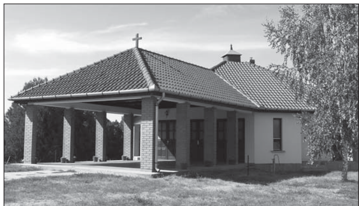
A települési összefogással elkészült új ravatalozó épülete

A hivatalos építési engedély 1991. március 27-én kelt, a műszaki átadásra 1992. október 28-án került sor. Az elkészült új ravatalozót Gyulay Endre megyéspüspök szentelte fel a város lakói, illetve az építés során közreműködő szakemberek és önkéntes munkások jelenlétében.