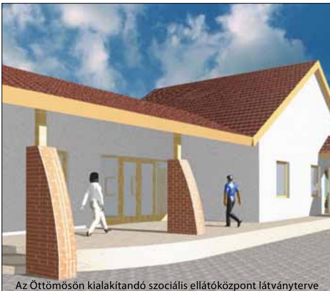
Az Öttömösön kialakítandó szociális ellátóközpont látványterve

A Homokháti Kistérség Többcélú Társulása mintegy 75 millió forint támogatást nyert a szociális alapellátás fejlesztésére Öttömös és Pusztamérges településeken a Dél-alföldi Regionális Program keretei között kiírt pályázaton. Pusztamérgesen a régi gondozási központ újul meg teljes körűen, Öttömösön pedig egy új alapellátó központ jön létre a támogatás eredményeképpen. Az önkormányzatok mintegy 4 millió forint saját forrást biztosítanak a fejlesztéshez.