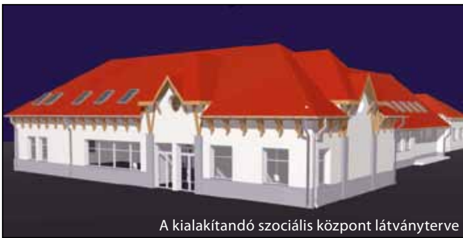
A kialakítandó szociális központ látványterve

A Homokháti Kistérség Többcélú Társulása mintegy 100 millió forint támogatást nyert a Dél-alföldi Regionális Operatív Program keretei között Zákányszéki szociális szolgáltató központ kialakítására.