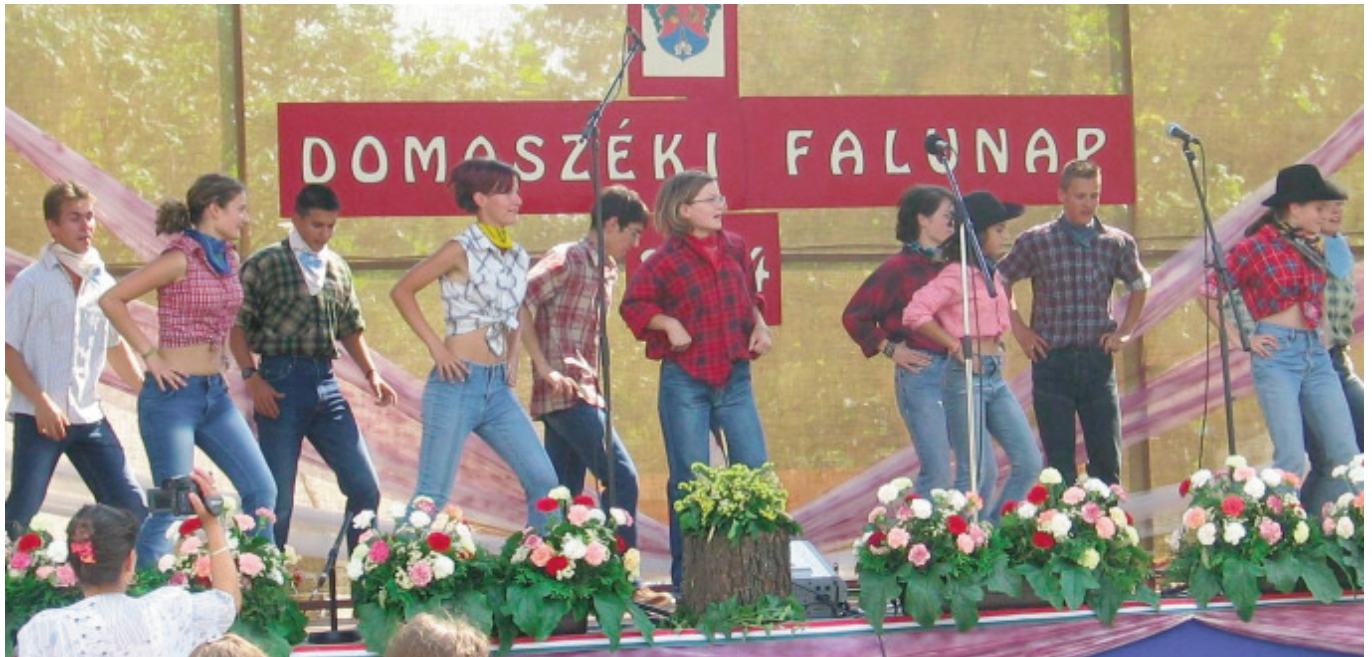
Az ifjúsági önkormányzat fellépése a falunapon

A Térségi Tükör előző lapszámában induló, és áprilisi megjelenő ifjúsági mellékletünkben minden alkalommal bemutatkoznak az egyes homokháti települések ifjúsági szervezetei, vagy magát a település ifjúsági életét jellemző helyzetet mutatják be a fiatalok. A célzottan az ifjúságnak szóló, de minden korosztályt megszólító melléklet másik részét képezi egy-egy olyan cikk, amely a témák korosztályi jellegéből adódóan talán tanulságos információkat hordozhat a fiataloknak (is). Márciusi ifjúsági mellékletünkben a domaszéki és a röszei fiatalok tárják fel elképzeléseiket, terveiket, kitérve egy kicsit a múltra, és a jelenre is, sőt megfogalmazznak egyfajta „hitvallást” is a szervezeteiket vezérlő gondolatokról. Az ifjúsági témájú cikkek sorában ezúttal az I. Homokháti Ifjúsági Találkozóóról olvashatnak. A térségi ifjúsági programokkal, elképzelésekkel, és ötletekkel kapcsolatos információkkal hozzánk fordulókat örömmel és szeretettel várjuk a Térségi Tükör szerkesztőségében!