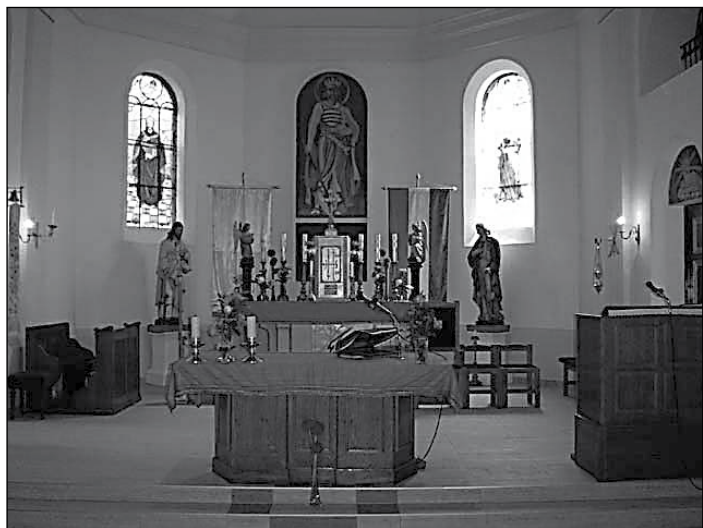
Szent László főoltárkép