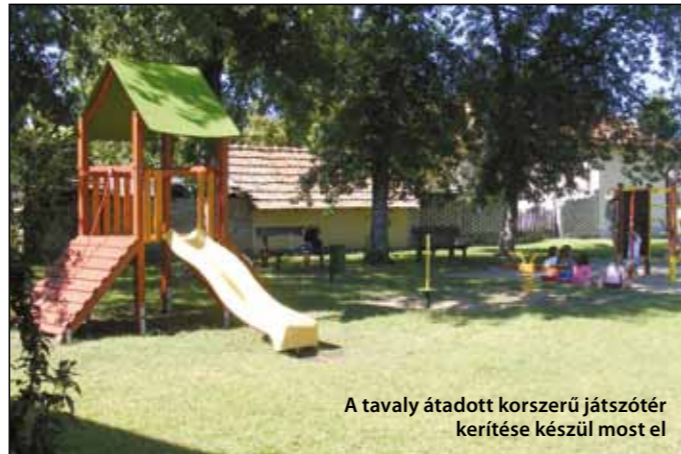
A tavaly átadott korszerű játszótér kerítése készül most el