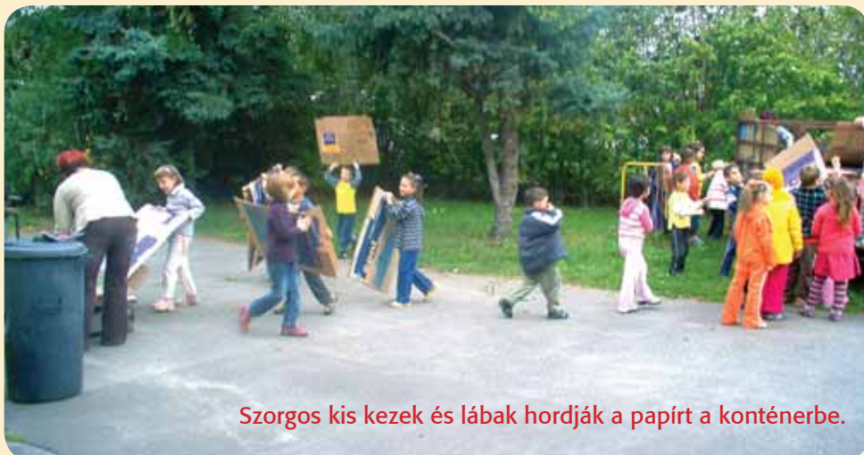
Szorgos kis kezek és lábak hordják a papírt a konténerbe.