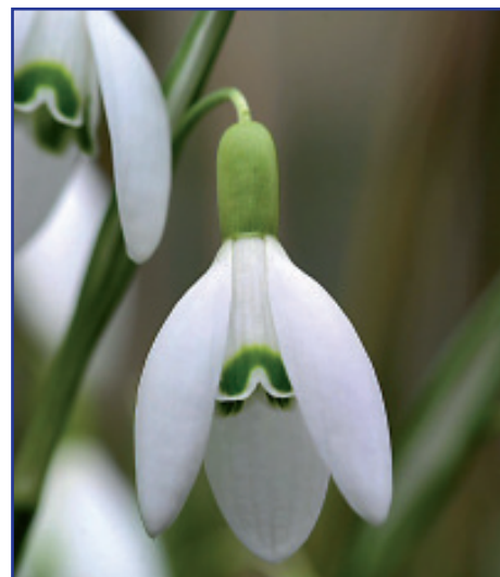
A Szerkesztőbizottság nevében: Szabó Kati

Élet. A közérdekű hírek és közlemények mellett az új Körképben nagy hangsúlyt fektetünk arra, hogy olyan témákról írjanak helyi, vagy a városhoz sok ezer érzelmi szállal kötődő személyek, amelyek tényleg érdeklik a Mórahalmiakat és a város iránt érdeklődőket. Célunk, hogy minél több ember lelkébe csempésszünk egy kis hitet, hogy igenis van jövő, szeretetet, amivel egymás felé fordulhatunk, méltóságot, amellyel a saját, helyi értékeinkre büszkék lehetünk, és egy csipetnyinél több életkedvet, amely szívből reméljük, hogy „átjön” az újság lapjain. Wass Albert a Tavasz-várás című versében a következőképpen ír: „Érzed? Jön a tavasz, a fák alá már tarka-fátylú verőfényt havaz. A messzeségből hírnök érkezett: madár lebeg a rónaság felett s fény szállt a holt avarra: Hóvirág” Igen, közeleg a tavasz, fuvallatát már érezni lehet a levegőben, reméljük, úgy érzi Ön is Kedves Olvasó, hogy „kitavaszkodik” a Körkép is.