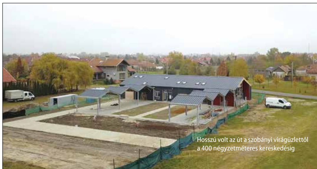
Hosszú volt az út a szobányi virágüzlettől a 400 négyzetméteres kereskedésig

A helyiek már jó ideje észrevehették, hogy a régi vásártéren egy új épület kezd felépülni, amelynek