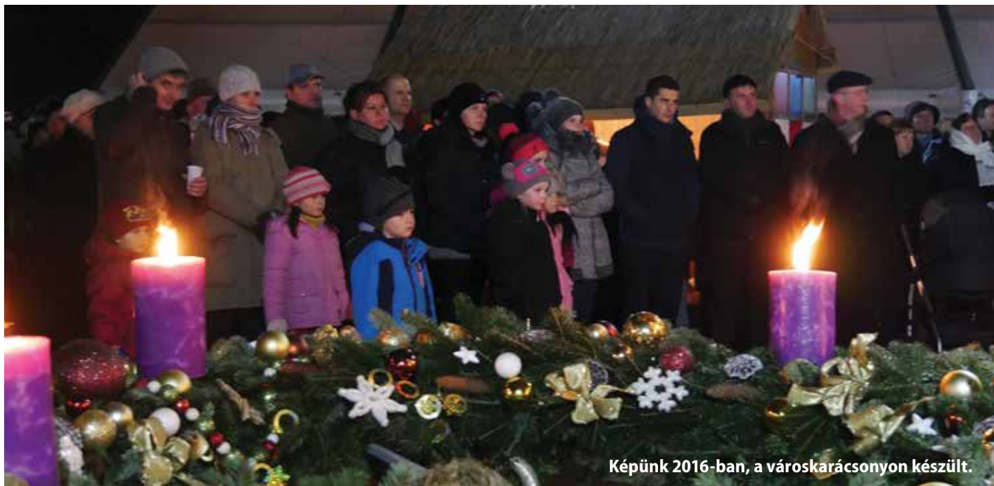
Képünk 2016-ban, a városkarácsonyon készült.

Aki valóban tud várni, abban megszületik az a mélységes türelem, amely szépségében és jelentésében semmivel se kevesebb annál, amire vár.