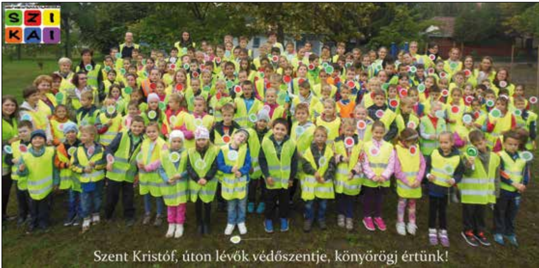
Szent Kristóf, úton lévők védőszentje, könyörögi értünk!