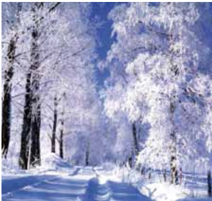
Kis István Mihály: Betlehemi tájon

Ruzsán a szökökútnál gyűlnek össze a község lakói az adventi vasárnapokon 15 órától. December 11-én az általános iskolások adták elő köszöntőiket, december 18-án pedig az egyházközség mutatja be ünnepváró műsorát. A Községi karácsonyra december 20-án, kedden 15.30-tól kerül sor a művelődési házban, ahol a helyi iskola és óvoda műsora után köszöntik az ez évben Ruzsán született babákat.