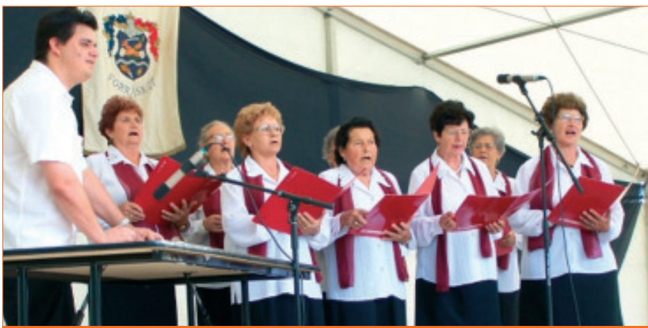
Színpadon az Őszirózsa Népdalkör a 2007. évi falunapon