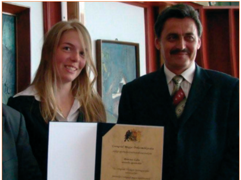
Kincses Lilla és Gyovai Gáspár alpolgármester (Csongrád)