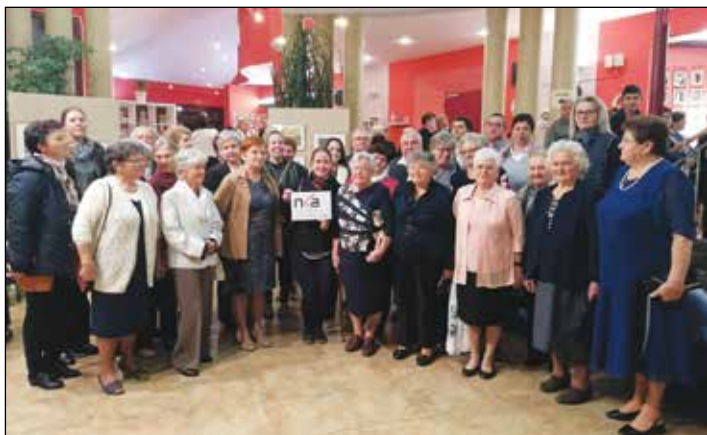
A Homokháti Szociális Központ Ásotthalmi, Zákányszéki és Móraalmi Tagintézményének idősök nappali ellátását igénybe vevő

A Nemzeti Kulturális Alap által nyújtott 205108/07435 pályázati azonosító alapján a Homokháti Szociális Központ részére nyújtott pályázati támogatás keretében két tartalmas program biztosítására nyílt lehetőségünk az ősz folyamán.