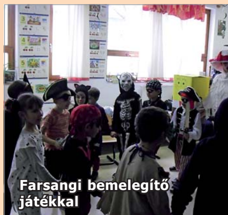
Farsangi bemelegítő játékkal