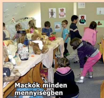
Mackók minden mennyiségben