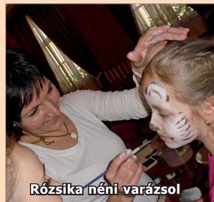
Rózsika néni varázsol