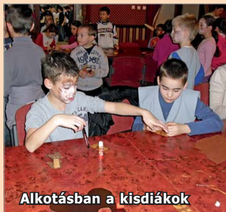
Alkotásban a kisdíjak