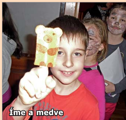
Íme a medve