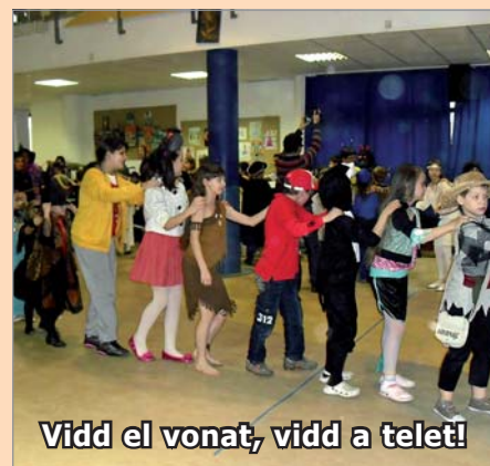
Vidd el vonat, vidd a telet!