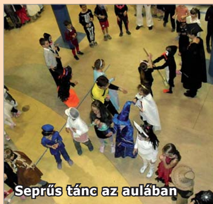
Seprűs tánc az aulában