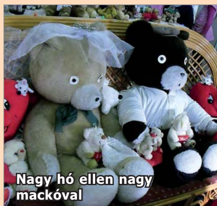
Nagy hó ellen nagy mackóval