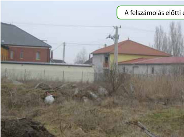
A felszámolás előtti és utáni kép a területről: