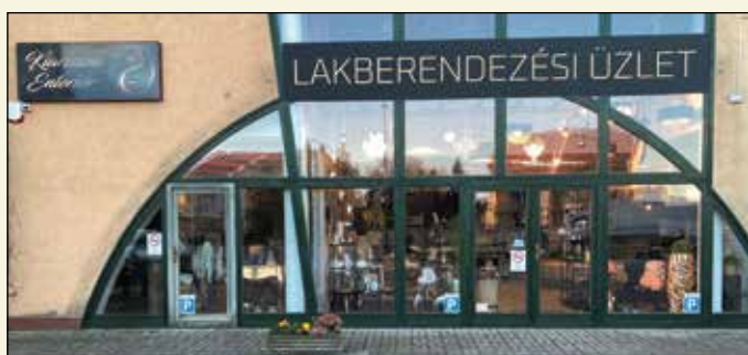
LAKBERENDEZÉSI ÜZLET MÓRAHALOM KLARISSZA ENTERIÓR