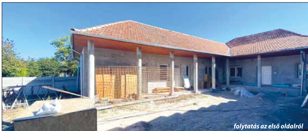
folytatás az első oldalról

A szobákhoz kapcsolódni fog egy terasz, amely hasznos, hiszen lehetőség lesz a kinti altatásra. A főzés a meglévő közvetlen szomszédság-