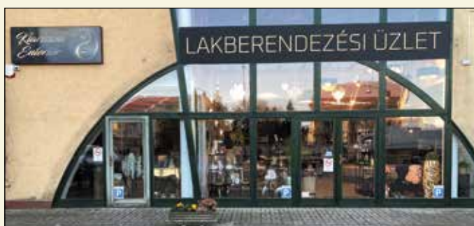
LAKBERENDEZÉSI ÜZLET MÓRAHALOM KLARISSZA ENTERIÓR