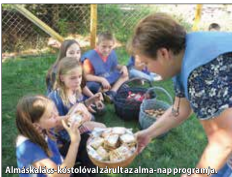
Almáskalás-kóstolóval zárult az alma-nap programja.

Szeptember 1-jétől, első alkalommal, három éven át viselheti iskolánk az Ókiskola címet. Eddigi zöld törekvéseinket továbbra is folytatjuk, és folyamatosan új ötletekkel bővítjük.