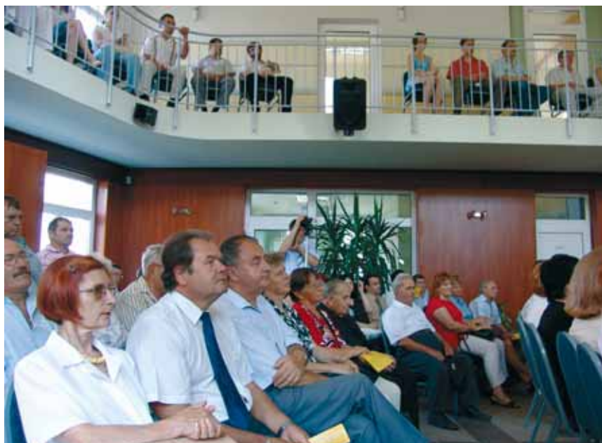
Nagyszámú érdeklődő vett részt a megnyitón az impozáns teremben

Röszkén új Térségi Konferencia- és Képzési Központot avattak június 14-én, csütörtökön az Interreg Határon Átnyúló Együttműködési Program keretében.