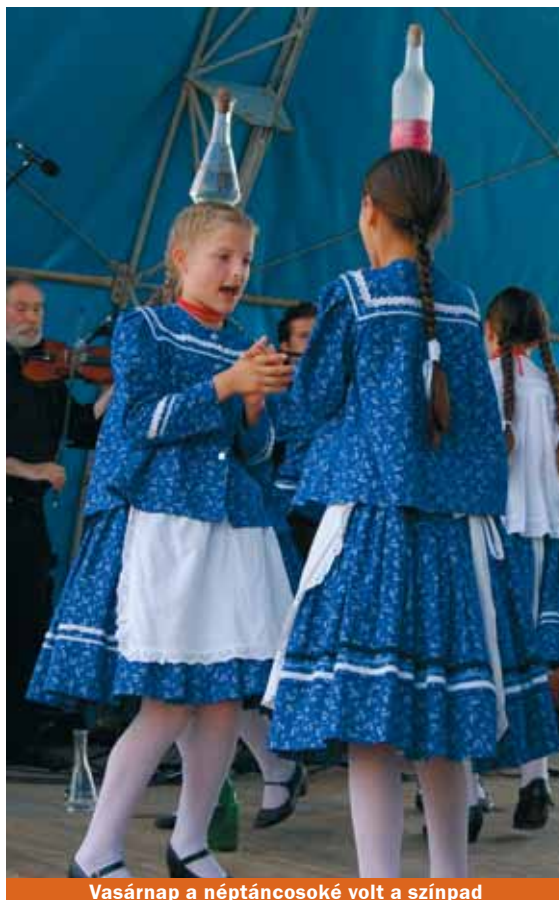
Vasárnap a néptáncosoké volt a színpad