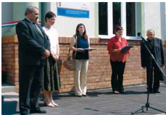
Előtérben a két település polgármestere az avatás előtt

A Térségi Konferencia- és Képzési Központot a Röszei Polgármesteri Hivatalhoz építették úgy, hogy ikerépület hatására keltve tökéletesen illeszkedjen a környezetébe. A helyi iskolával szemben, a templom és a Polgármesteri Hivatal „társaságában” található épület valóban olyan benyomást tesz a szemlélőre, mintha mindig is ott állt volna. Az impozáns előadóterembe belépve a modern tolmácsrendszerhez tartozó fülszék felül, az előadók számára kényelmes, tágas pulpitust emeltek. Az új épület rendeltetésével kapcsolatban a megnyitón elhangzott, hogy konferenciákat, előadásokat tartanak majd itt, de oktatási célra is kiválóan megfelel. A nagy-