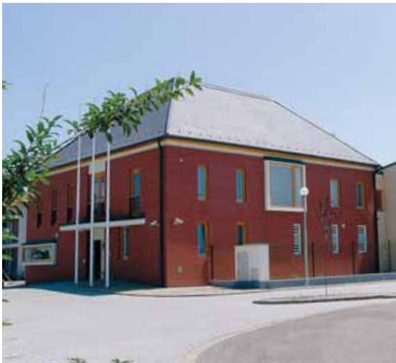
Az új szolgálati hely István király úti épülete

itt épült fel a kirendeltség kihelyezett szolgálati helye. Az István király úti építkezés 2006 nyarán kezdődött. A kivitelezés költségeit a Schengen Alapból finanszírozták, amelynek teljes