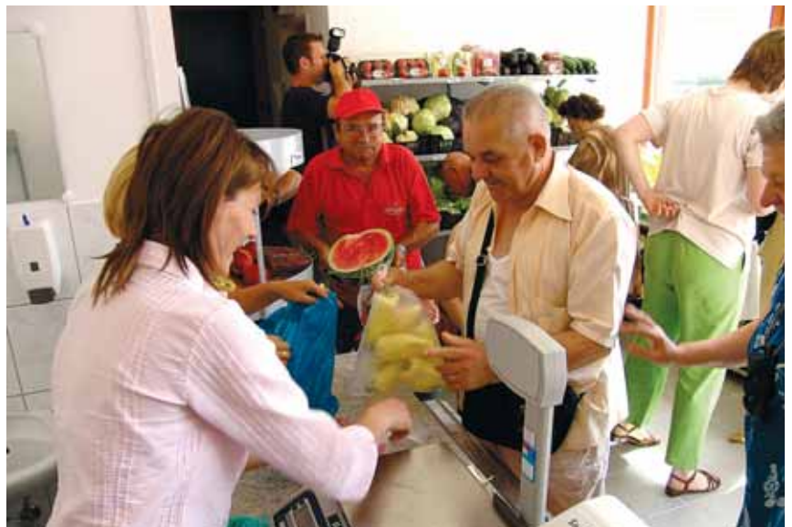
Az első órában több mint százán fordultak meg az új üzletben