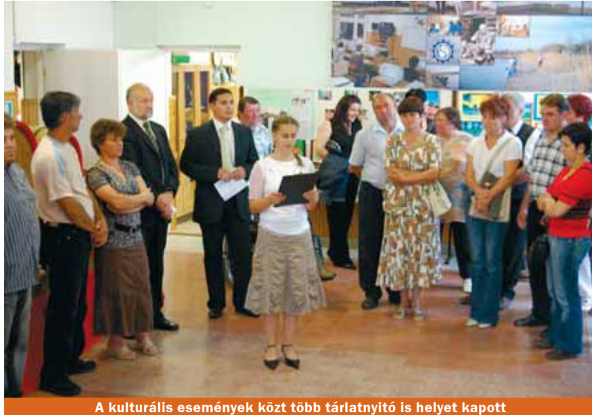
A kulturális események közt több tárlatnyitó is helyet kapott

– A szombati napon, statisztikáink alapján,