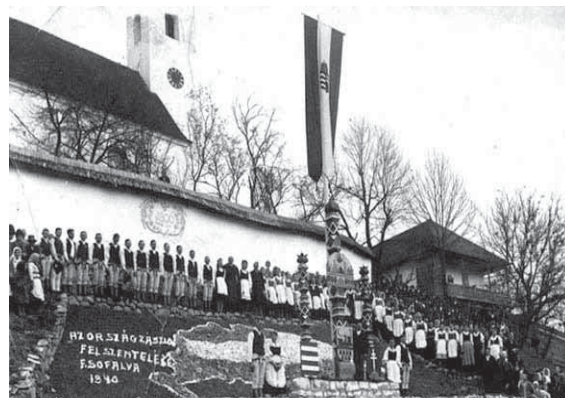
Országzászló-szentelés Erdélyben (1940)

Csongrád megyében Szegednek, Hódmezővásárhelynek és Makónak