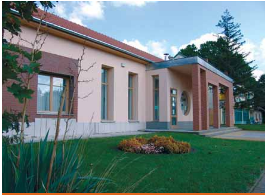
A Millenniumi sétány 17. szám alatt kapott helyet a Földhivatal móraalmi kirendeltsége

A földhivatali munkatársak a 281-036-os telefonszámon érhetők el az alábbi ügyfélfogadási időben: