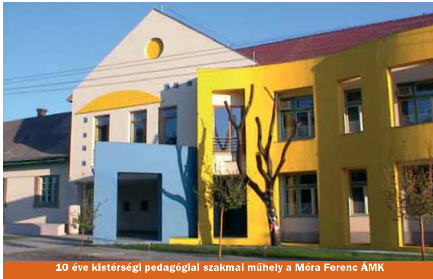
10 éve kistérségi pedagógiai szakmai műhely a Móra Ferenc ÁMK

PSZ); tevékenységének bemutatására több ízben felkérték különböző szakmai rendezvényeken és konferenciákon (ÖTATE – Encs, 2001, Rétközi Iskolaszövetség – Ibrány, 2002, Kistérségi együttműködések – Pilisborosjenő, 2002, OKNT Nyíregyháza 2004, Kiskőrös 2006), valamint a Szegedi Tudományegyetem JGY-TFK Közoktatás-vezetői Programjában (2001-2006).