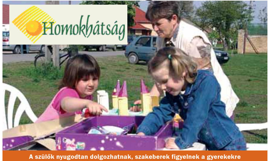
A szülők nyugodtan dolgozhatnak, szakemberek figyelnek a gyerekekre

A Homokháti Kistérség valamennyi települése nagy külterülettel, tanyavilággal, többnyire magányosan, izoláltan élő idősödő népességgel rendelkezik. A szociális szolgáltatások között ezért rendkívül nagy jelentőségű a jelzőrendszeres házi szociális gondozás kiépítése és működtetése. A jelzőrendszeres házi segítségnyújtás gesztor települése Mórahalom . A szolgálat feladata a saját otthonukban élő, egészségi állapotuk és szociális helyzetük miatt rászoruló idős korú vagy fogyatékos személyek felmerülő krízis helyzetinek elhárítása. A szolgáltatáshoz speciális technikai eszközök felszerelésével illetve beüzeme-