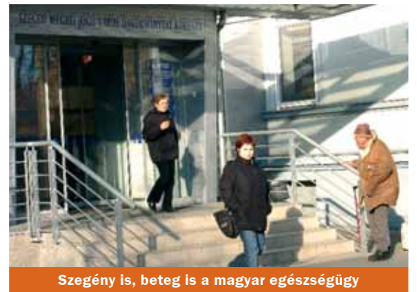
Szegény is, beteg is a magyar egészségügy