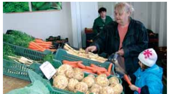
Ápriltól Szegeden is kaphatók a homokháti zöldségek

A vásárlók eddig a hiper- és szupermarketekben, diszkont áruházakban találkozhattak a Mórakert Szövetkezet termékeivel. A csomagolt áruknál könnyű volt a megkülönböztetés, a kimért zöldség-gyümölcsnél viszont nem tudhatta a fogyasztó, mikor vá-