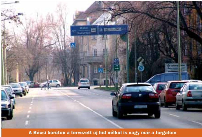
A Bécsi körúton a tervezett új híd nélkül is nagy már a forgalom

Átalakulhatnak a szegedi közlekedési szokások