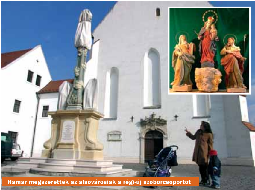
Hamar megszerették az alsóvárosiak a régi-új szoborcsoportot

Mikorra lesz teljes a Mária-szoborcsoport?