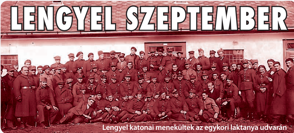
Lengyel katonai menekültek az egykori laktanya udvarán