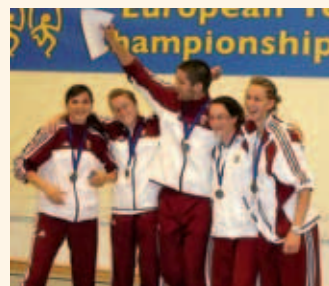
A senior csapat

a rengeteg munkaórájának, ami ide vezetett.