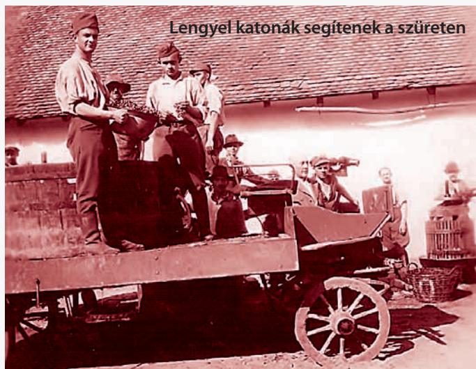
Lengyel katonák segítenek a szüreten