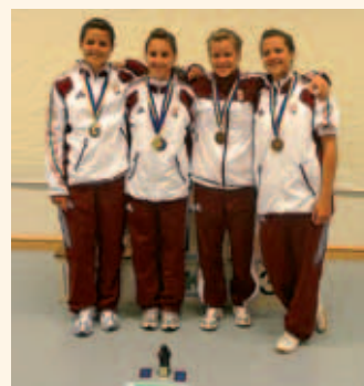
A junior csapat

Legnagyobb örömeinkre nem így volt, csak rosszul írtunk fel egy pontszámot, s az egykötteles versenyszámokban a harmadik legjobb eredményt elérve, a mórahalmi csapat tagjai felállhattak a dobogóra. Óriási öröm volt. Fent álltak a dobogón a nemzeti válogatott melegítőben Európa legjobbjaival , s gyönyörű érmet akasztottak a nyakukba. Abban a pillanatban elfelejtettünk minden kint, a rengeteg munkát, nehézséget, csak azt éreztük, hogy megérte, lett eredménye a sokszor emberfeletti energia befektetésnek,