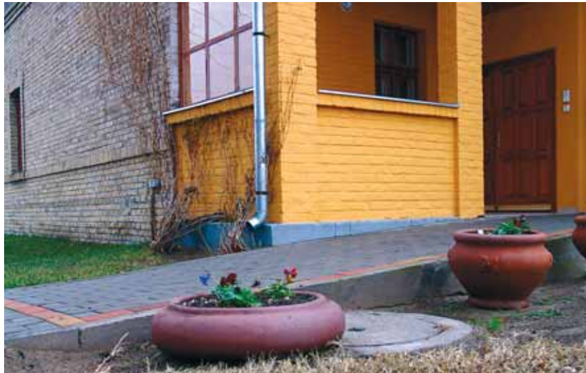
Már több településen megvalósult az akadálymentesítés

írásához és nyertes pályaművek esetén a lebonyolításhoz.