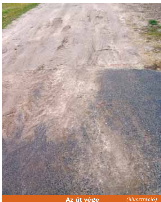
Az út vége

A tervezett költség 55.000.000 Ft, melyből az önerő 5.500.000 Ft, a fennmaradó összeg pedig pályázati összegből valósulna meg.