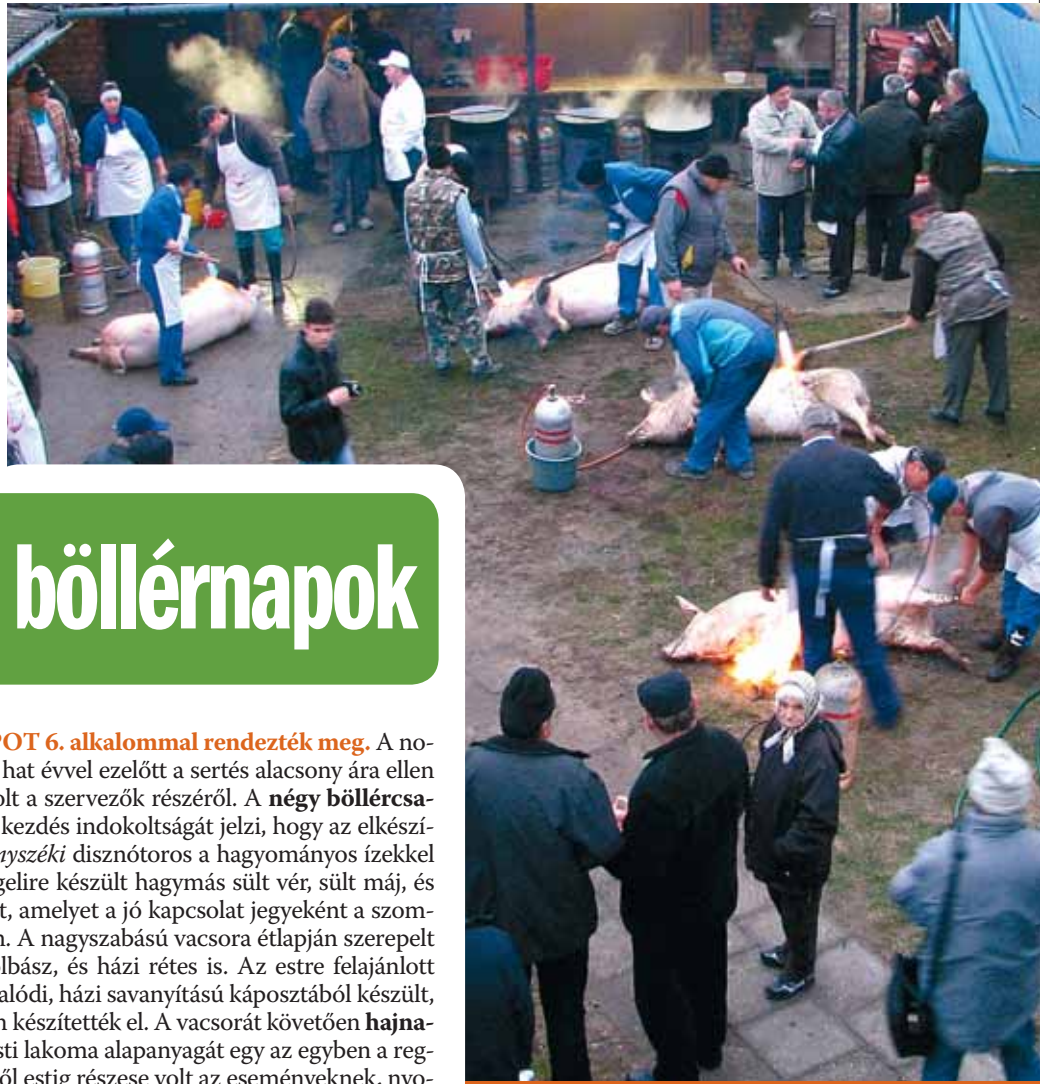
Munkában a zákányszéki böllérek

A hagyományos magyar paraszti világban mindennek meg volt a maga ideje, így a disznóölésnek is. November hava, Szent András hava sok más egyéb mellett a disznótorok időszaka is. Az e hónapban tartott domaszéki és zákányszéki Böllérnap ennek a szokásnak állít emléket.