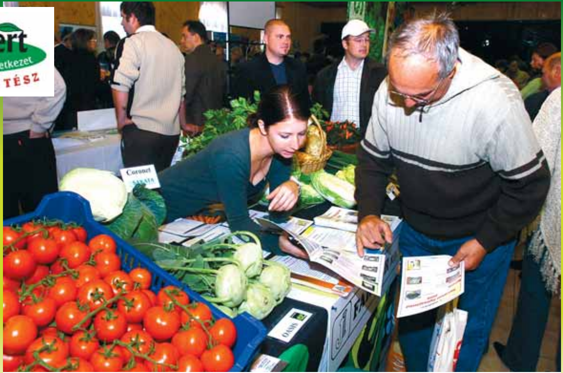
Beszállítókkal és termékfajtaikkal ismerkedhettek a kereskedők

Egész napos vetőmagbörzét, kertészeti szakkiállítást és előadásorozatot rendezett a Mórakert Szövetkezet október 27-én Mórahalm on, a Pötkerék Csárdában, amelyre összes partnerét, beszállítóját és 750 tagját is meghívta a Magyarországon elsőként elismert tész.