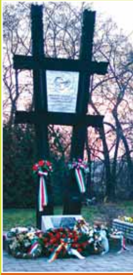
A Magyar L. emlékmű