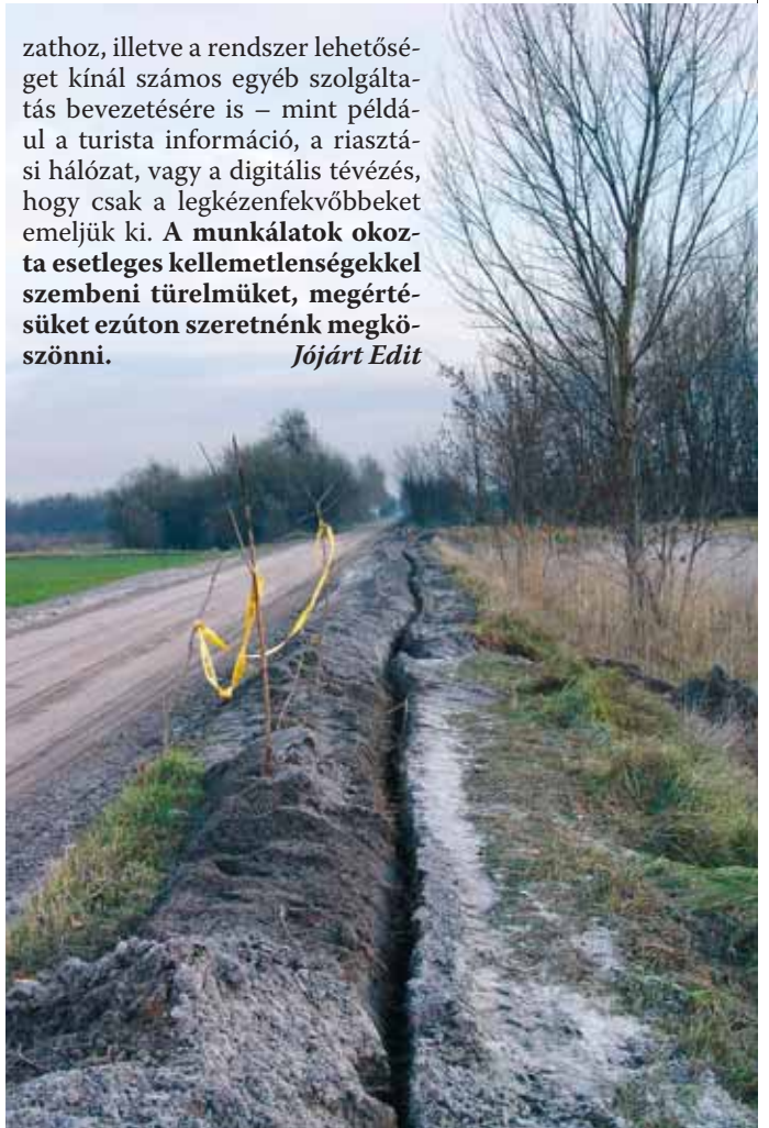
Az optikai hálózat vezetékeit a föld alá helyezik