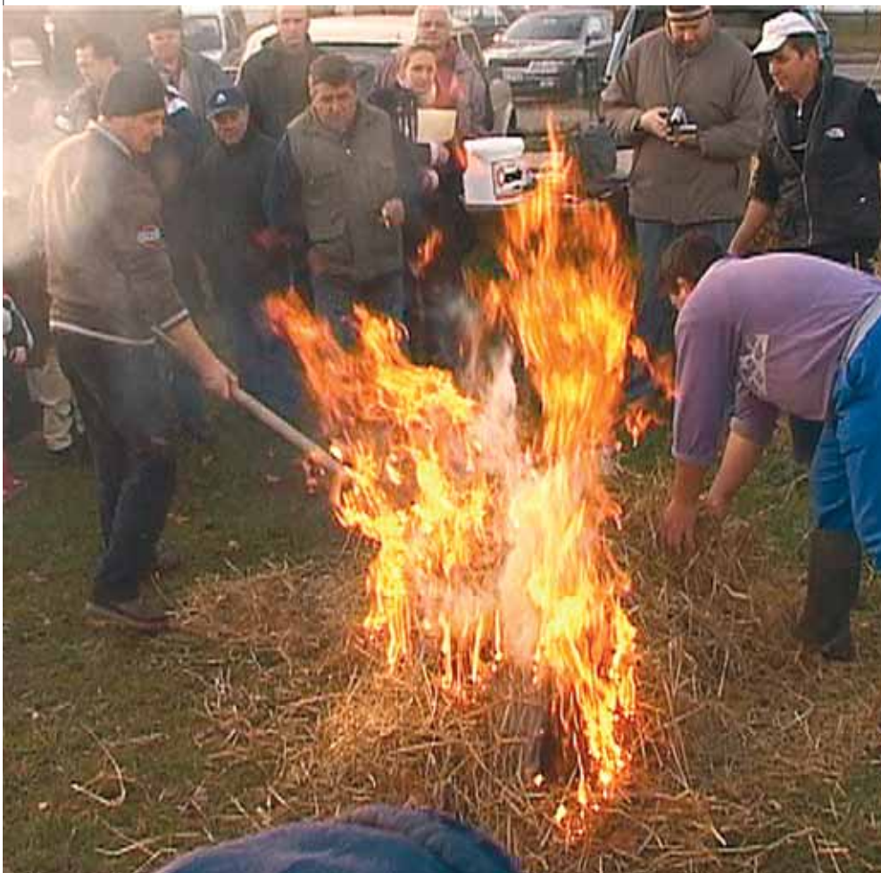
A Domaszéki Böllérnapon hagyományos módon szalmával pörzsölték a disznót