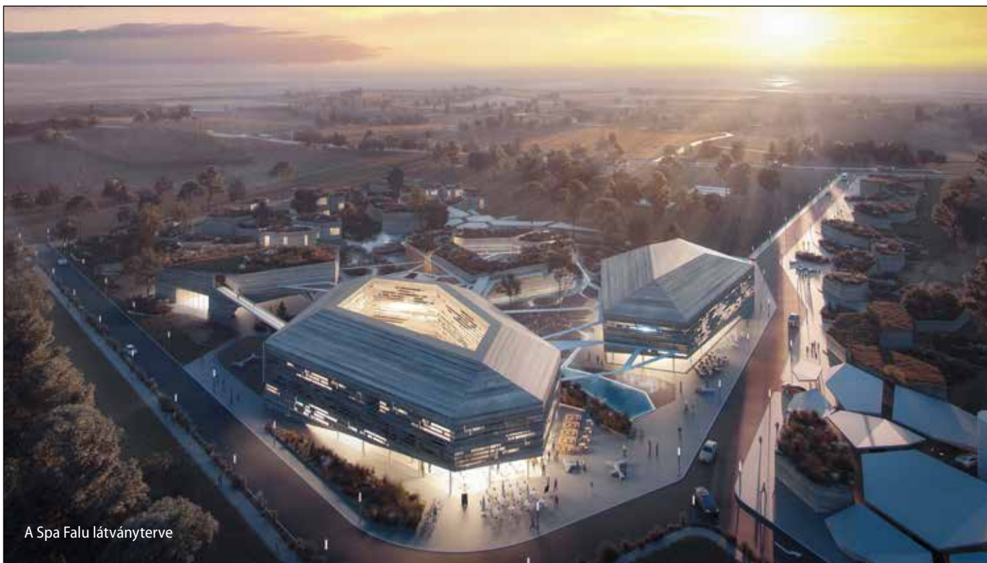
A Spa Falu látványterve

A mórashalmi önkormányzat megbízásából a számos nemzetközi építészeti díjjal kitüntetett természetközeli szálláshelyet, az Artkazalt megvalósító, Atrgroup építésziroda, valamint a LAB5 architects egy ökofalu terveit készítette el Spa Falu néven.