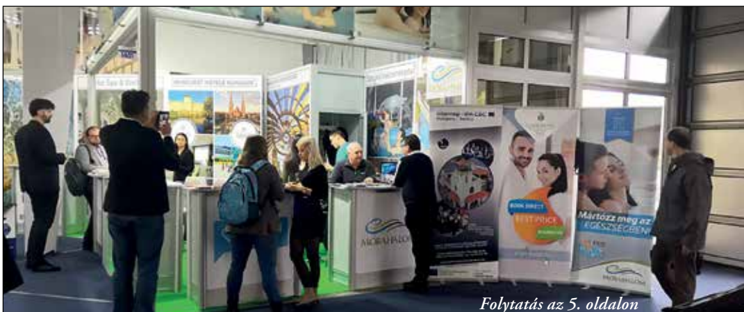
Folytatás az 5. oldalon

A február 20-23. között, immár 42. alkalommal megrendezett belgrádi Idegenforgalmi Vásáron mintegy 700 kiállító vett részt több mint 40 országból. A vásárt Rasim Ljajić idegenforgalmi miniszter nyitotta meg, Aleksandar Vučić Szerb államfő jelenlétében.