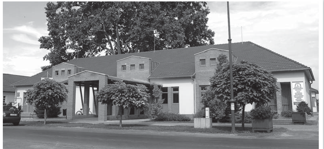
A Móra-Vitál által végzett szakellátások:

A Móra-Vitál Mórahalom és Zákányszék belterületén otthoni szakápolást is végez. A tüdőgondozó ellátási területe ennél jóval nagyobb: kiterjed a Homokháti Kistérség min-