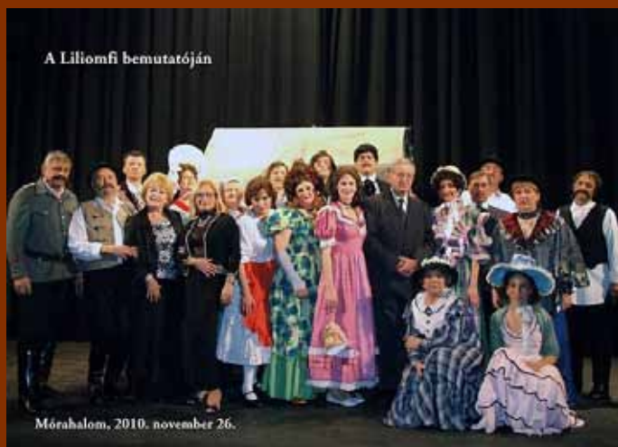
A Liliomfi bemutatóján

Legyünk büszkék reá, hogy színészek vagyunk.”