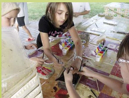
Könyékig a munkában