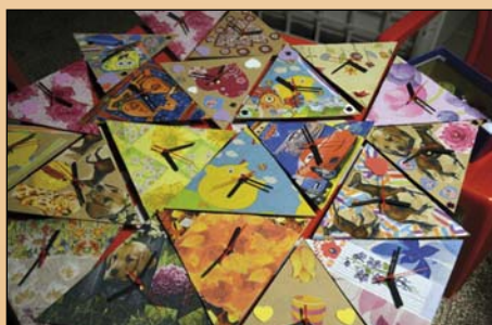
Az elkészült órák