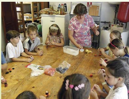
Így készültek ...

Képes beszámoló 8. oldalunkon olvasható cikkünk mellékelteként