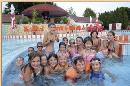
A legkitartóbbak a vízben