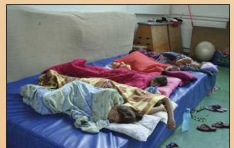
Erőgyűjtés a folytatáshoz