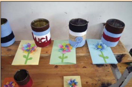
Ceruzatartó és meghívó

Talán a szavaknál is többet mondanak a képek.