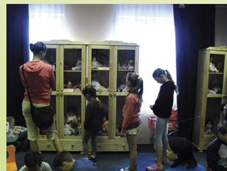
Nézelődés és játék a Babakiállításon