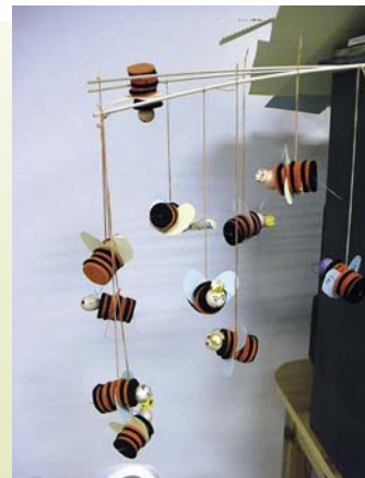
... ilyenek lettek.