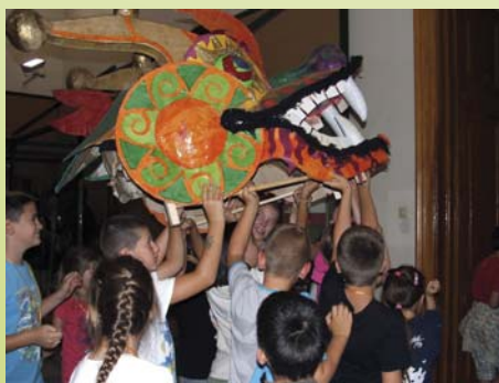
A Sárközi sárkány útja a pincébe.