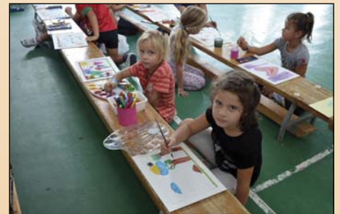
Készülőben a puzzle