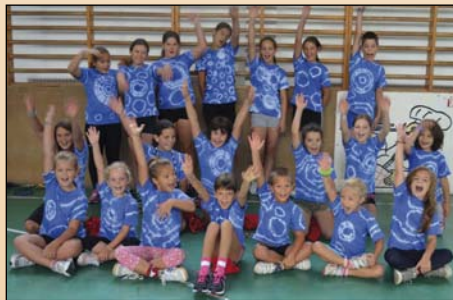
Batikolt a csapat