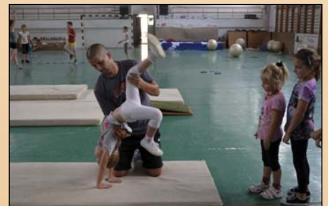
Picik a tornán