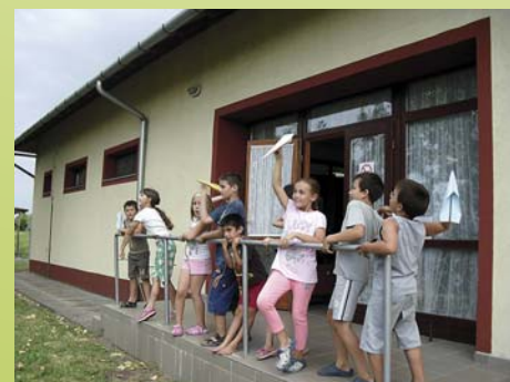
A „puding próbája”...