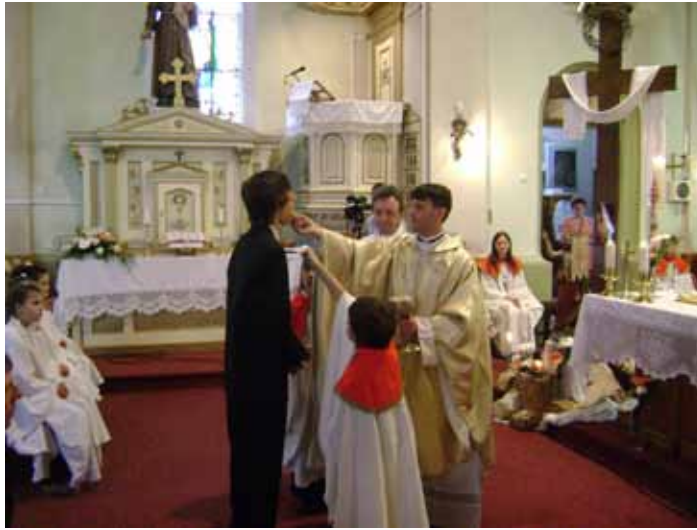
Képünk a 2009-es elsőáldozáson készült

Amikor mi kisgyerekek voltunk, nemigen létezett még ovis hittan, sőt igazából iskolás korban sem volt mindenki számára egyértelmű a templomba járás szabadsága, lehetősége. Istentől leginkább akkor hallottunk, amikor nagyszüleink – akik azért mégiscsak eljárógtak a misékre, imaórákra – meséltek nekünk róla. Jézus a legtöbb családban talán csak Jézuskaként, vagyis a karácsonyi ajándékok felelőseként jelent meg, és a csomagok kibontása után